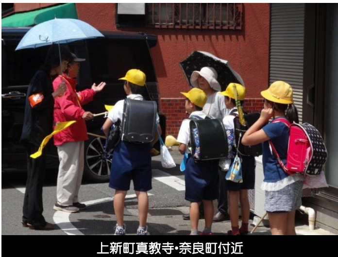
上新町真教寺・奈良町付近

から、「私たちも、近所の人に育てられてきたからな。思おくりやわ。」とか「お互いの仲間意識ができて、顔を見ないと心配な時も。」などと温かいお言葉を伺うようになりました。笠小児童も223名で、2年生、4年生、5年生は1学級で、2年生においては21人学級です。児童数は減少していて、親御さんの負担は大きくなり、子どもたちの人との関わりの幅は小さくなりがちです。こういう時世だからこそ、地域の力が必要となり、多くの人と関わりをもち、経験と感性を磨き、夢を育み、はばたける子どもたちを育てていきたいものです。毎朝の登校時のお見送りと声かけ、下校時の見守りを今後とも直しくお願い致します。