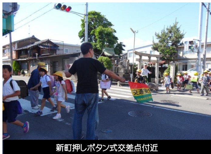
新町押しボタン式交差点付近

町内会のご協力を得て、安全安心サポーターを募り、本年度より126名の登録をいただき、見守り活動が始まりました。多くの皆様方のご支援により、笠小の子どもたちが毎日元気よく登下校しています。毎日が安全安心で過ごせる地域は、平凡で変わり映えなく過ごしがちですが、そこには多くの地域の方の目配り、気配り、心配りがあることを忘れてはなりません。大人である私たちが地域づくりに携わることで、子どもたちが健やかに成長できることは地域にとっての宝物です。登校中は早朝で眠気もあり、おとなしい子ども下校時になると元気良く帰宅の途につきま。子どもたちの感想に「地域のおじさん・おばさんがやさしく声をかけて下さってうれしく思います。」や「だんだんとこのおじさんか顔がわかってきた。」など毎日のことで顔と顔がつながって、高学年にもなると感謝の気持ちが芽生えてきています。また、大人の見守る側の立場