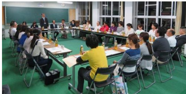
笠小コミュニティ・スクールサポート部会全体会

子ども達が生きていくこれから先の世の中は、急速な情報化や技術革新により、人間の生活が大きく変わっていくことでしょう。しかし、人工知能がいかに進化しようとも、ふるさと笠松で育ま