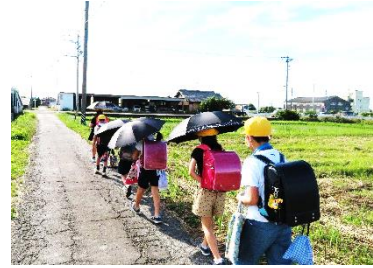
<晴れでも傘をさして登校>