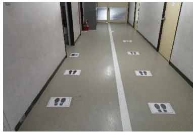
<トイレの順番待ちの印>