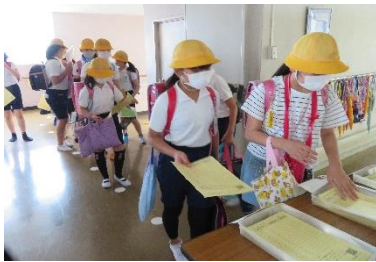
<毎朝の健康チェック>

15日からの登校時、600人弱の子ども達が玄関に密集することを心配しましたが、地区によって登校時刻をずらしたことで比較的混雑せずに校舎に入ることができています。他にも感染防止に向けて3密を避けるため、以下に示すように様々な取組をしていますが、何より子ども達がわがままを言わず協力的であるため、スムーズに進んでいます。