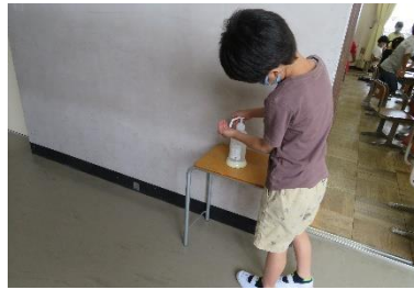
<登校後、給食前には消毒>