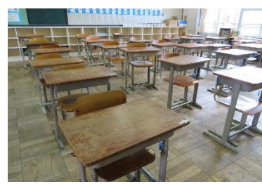
<隣と間隔をとった座席>