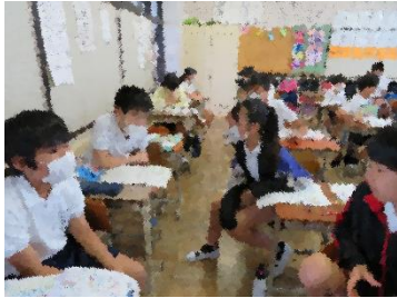
<机を離れたまま交流>